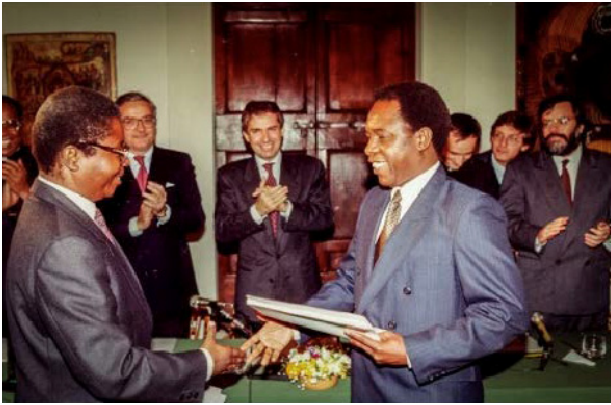
Negociacions de pau de Moçambic (1992)

Els homes i les dones de religió no tenen cap altra eina a les mans que la recerca de Déu, l'amor pels homes i la pregària, una «força dèbil» que, rebutjant radicalment la violència i brandant l'arma del diàleg, demostra una capacitat extraordinària d'apropar els que estan allunyats, de posar en