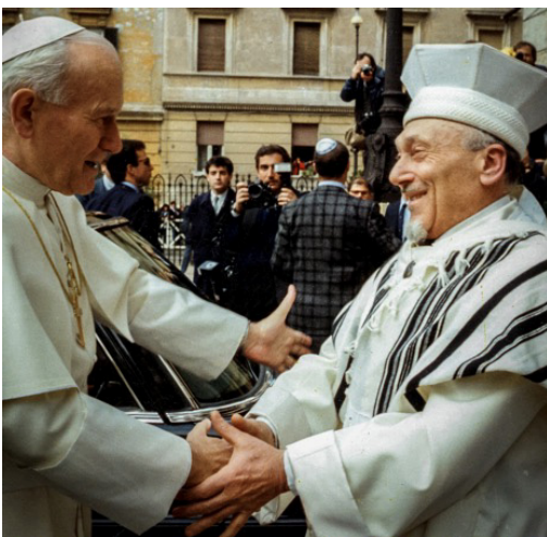
Abraçada entre el papa Joan Pau II i el rabí Elio Toaff, Roma, 1986

Anunciada solemnement el 25 de gener de 1986 a la basílica de Sant Pau Extramurs, la iniciativa de Joan Pau II d'invitar els líders de les religions mundials per celebrar una jornada de pregària per la pau s'inseria en la línia dels seus viatges de 1979 a Turquia i de 1985 al Marroc, durant els quals s'havia reunit amb líders i joves musulmans, i després de les quals, precisament pocs mesos abans d'Assís, va dur a terme la visita a la sinagoga de Roma el 13 d'abril de 1986.