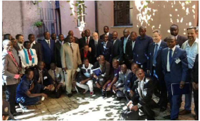
Negociacions de pau per a la Rep. Centreafricana (2017)

diàleg parts en conflicte, de trobar camins de pau. Aquesta és la força que ha utilitzat la Comunitat de Sant'Egidio per buscar la pau en escenaris complicats, començant per Moçambic i seguint per molts altres llocs com Costa d'Ivori, Guatemala, el sud de les Filipines i, més recentment, Líbia i la República Centreafricana.