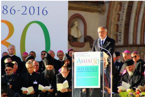
Intervenció d'Andrea Riccardi a Assís el 2016

El camí recorregut en aquests trenta anys ha fet caure els murs d'incomprensió i de distància que s'havien creat al llarg de la història, invitant homes de religió acostumats a viure únicament dins de la seva pròpia tradició a trobar-se. Al llarg d'aquesta peregrinació, etapa rere etapa, els participants lentament han pogut descobrir-se, concebre de manera diferent la seva missió i el seu servei, crear un lligam profund amb altres persones, provinents de tradicions diferents, superant així la identitat pròpia de cadascú. Ha estat una autèntica «escola de comprensió recíproca».