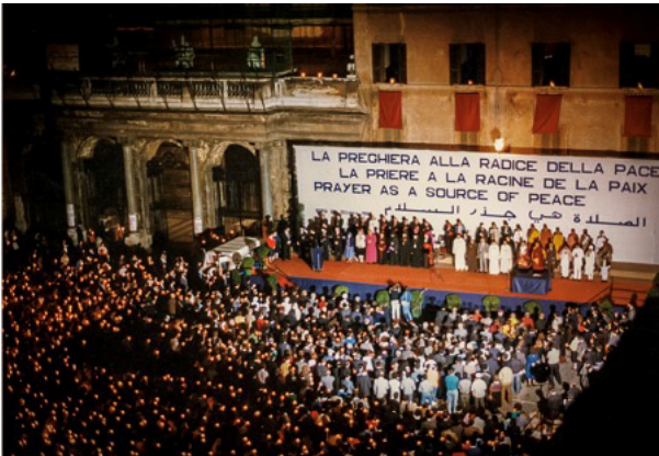
Trobada de Roma, 1987

En els posteriors missatges que enviarà als participants de les trobades anuals que organitzarà la Comunitat de Sant'Egidio, el papa Joan Pau II, en efecte, no deixarà de subratllar la seva felicitat pel fet que el 27 d'octubre de 1986 hagi tingut continuïtat: «M'alegra veure que el camí que va començar aquell dia continua, que passa per altres ciutats i arrossega cada vegada més homes i dones de diferents tradicions religioses». Assís no podia limitar-se a ser una cosa aïllada: «Aquella trobada tenia una força espiritual descomunal: era com una font a què hom torna per restablir la inspiració; una font capaç de desfermar noves energies de pau. Per