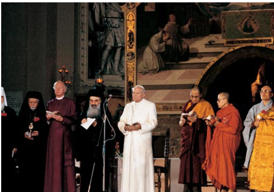
Peregrins de pau a la Porciúncula, Assís, 27 d'octubre de 1986

Assís 1986 va ser el fruit de la iniciativa personal de Joan Pau II, que va subratllar en diverses ocasions el seu caràcter excepcional d'«esdeveniment històric». Tal com va escriure el 1994, «per primera vegada a la història, homes i dones de religions i creences diferents es van reunir amb mi, al mateix sagrat lloc d'Assís per invocar el do de la pau a tot el món». I també: «Havia desitjat amb ardor aquella trobada; volia que, davant del drama d'un món dividit i sota l'espantosa amenaça de la guerra, brollés del cor de tots els creients un crit comú cap a aquell Déu que guia el camí de l'home pels viaranys de la pau».ii Més endavant va evocar un espectacle meravellós: «Tenia al meu davant com una gran visió: tots els pobles del món, provinents de diversos punts de la Terra, en camí per aplegar-se davant de l'únic Déu, com una única família».iii