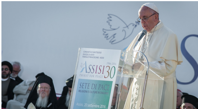
El papa Francesc a Assis el 2016

Des de llavors s'han multiplicat els gestos del Papa en aquesta direcció. Recordem, a tall d'exemple, la trobada a Abu Dabi amb Ahmad Al-Tayyeb, gran imam d'Al-Azhar, i la firma del Document sobre la fraternitat humana per la pau mundial i la convivència comuna».