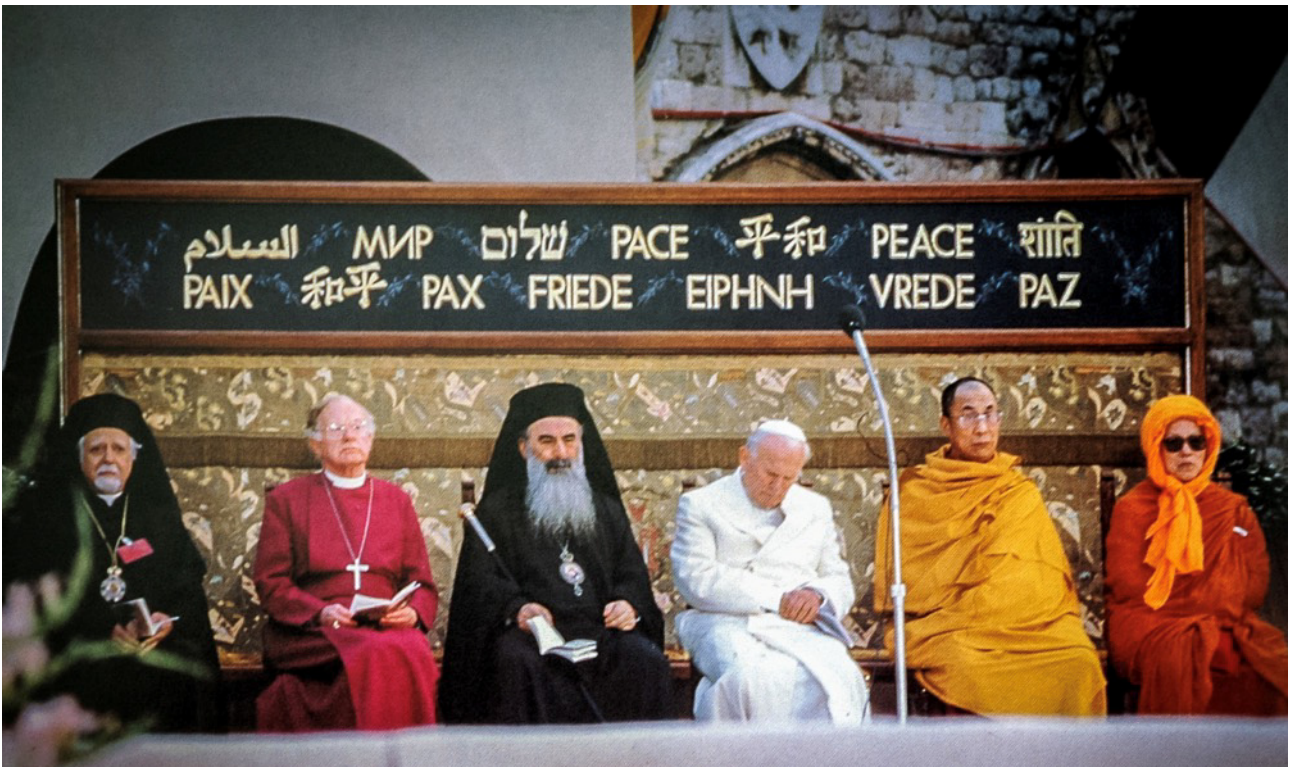
Assís 1986: els líders religiosos amb Joan Pau II

La foto de la Jornada Mundial de pregària per la pau d'Assís del 27 d'octubre de 1986, en què es veu el papa Joan Pau II amb els líders de les religions amb les seves virolades vestidures, és una de les imatges religioses més rellevants del segle XX.