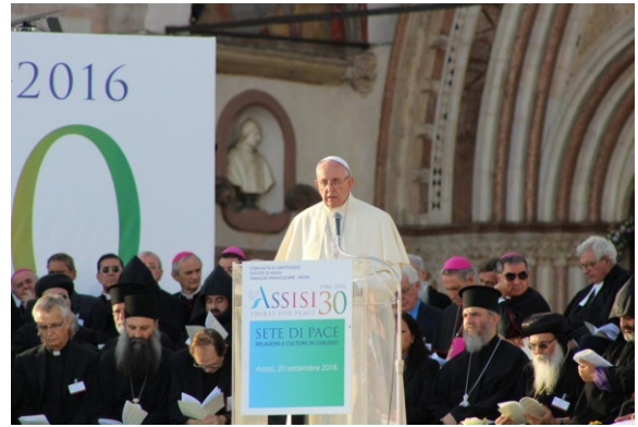
El papa Francesc a Assís el 2016

Han passat més de 30 anys. L'«Esperit d'Assís» segueix sent un referent que allibera les religions de la temptació de la violència, fomenta el diàleg entre elles i la recerca de la pau. Potser avui és més necessari que mai. El camí ha seguit, any rere any, per moltes ciutats del món. Ha despertat esperança. Ha obert processos que han permès posar fi a conflictes sagnants. Ha trencat el blasfem binomi guerra-religió. En la trobada que es va celebrar novament a Assís el 2016, trenta anys després d'aquella primera Jornada, el papa Francesc va parlar de la «gran malaltia del nostre temps: la indiferència. És un virus que paralitza, que fa inert i insensible. No podem seguir sent indiferents», va dir. «Avui el món té una abusadora set de pau. A molts països es pateix per les guerres, sovint oblidades, però que sempre són causa de sofriment i de pobresa. Només la pau és santa, no la guerra. El nostre futur és el de viure junts», bo i esperant que els creients de religions diferents «es trobin, s'apleguin i suscitin concòrdia, especialment allà on hi ha conflictes.»