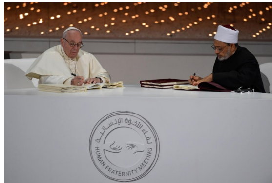
Firma del Document sobre la fraternitat humana a Abu Dabi, 4 de febrer de 2019