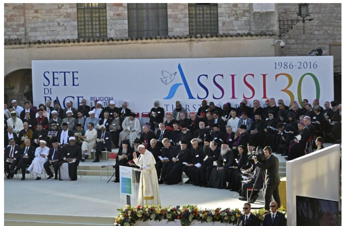
A la dreta, el papa Francesc a la cerimònia final d'Assís 2016

La Jornada per la Pau d'Assís representa no només una novetat de la història, sinó també la resposta a una exigència que ja en èpoques anteriors havia donat lloc a intents de trobada. El 1983, quasi un segle abans, l'Església presbiteriana i els bisbes catòlics dels Estats Units van organitzar a Chicago, de l'11 al 27 de setembre, la reunió d'un World's Parliament of Religions en què van participar 400 representants de setze tradicions religioses.